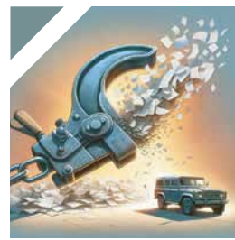
INFORMAZIONI SU REVOCA FERMO

L'utente può, inoltre, contattare il nostro team attraverso numeri dedicati, usufruendo del servizio SICALL attivo tutto il giorno con evasione richieste veloci e professionali attraverso l'uso dell'intelligenza artificiale.