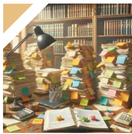
DUPLICATI E NOTIFICHE

Il cittadino può direttamente avere tutte le informazioni sugli atti ricevuti e/o presentare istanze o richieste attraverso la scansione del QR Code presente sull'avviso recapitato ottenendo riscontro in un breve lasso temporale attraverso il nostro servizio RISCOSSIONE SEMPLICE , strumento web facile da utilizzare che si propone come soluzione su misura al servizio del cittadino. Basta semplicemente compilare il form di contatto dedicato e si avranno risposte su: